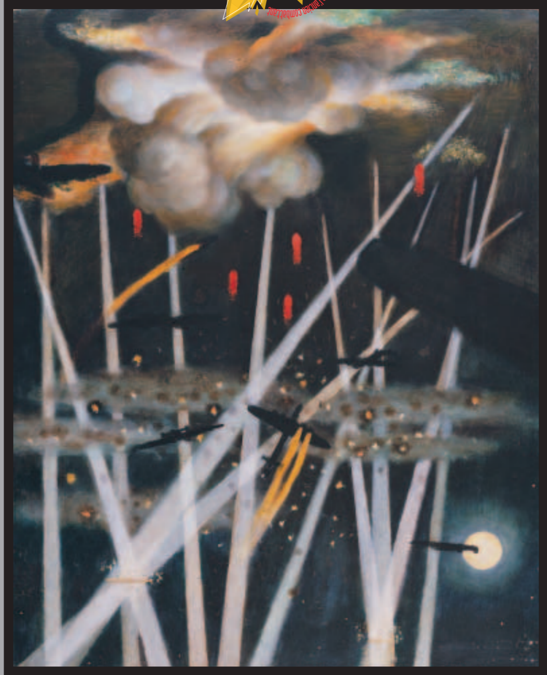
Vol. 6, No. 3, AUTUMN 2005