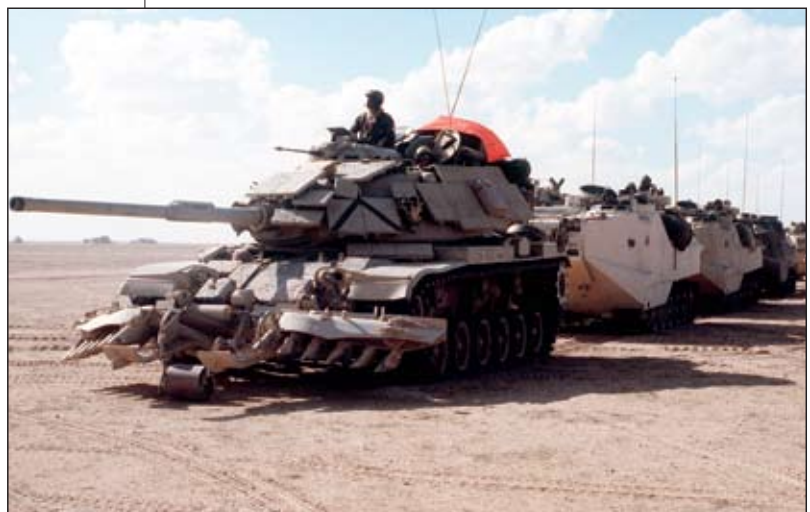
Un char de combat principal M60A-1, équipé d'un blindage réactif et de rouleaux de déminage, en tête d'une colonne de véhicules d'assaut amphibies AAVP-7A1 des Marines au Koweït au début de l'opération Tempête du désert .

À la suite de ces échanges, le nouveau directeur des études de la force terrestre, le colonel Keith T. Eddy, a recommandé que l'on examine de plus près l'évolution de la dimension opérationnelle aux États-Unis 32 . Cette proposition était probablement sus-