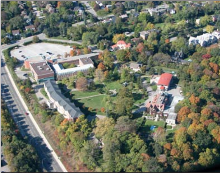
Vue aérienne du Collège des Forces canadiennes et des environs

et aux échelons inférieurs, tandis que le Collège des Forces canadiennes l'enseignerait à l'échelle du corps d'armée et aux échelons supérieurs. Bien qu'il soit possible de transmettre à des auditoires tactiques des concepts et des activités opérationnels, l'utilité du concept tel qu'il a d'abord été formulé en 1982 est limitée lorsqu'il s'agit d'activités de niveau inférieur à celui du théâtre d'opérations 24 .