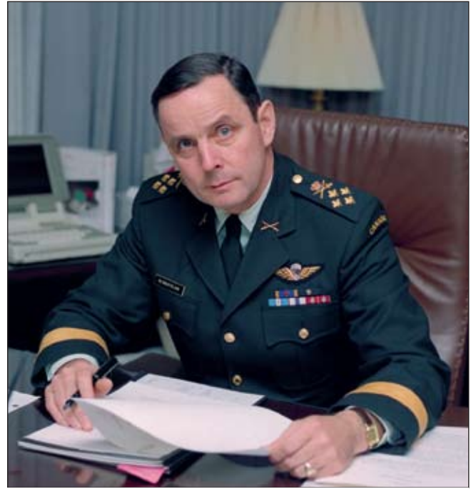
Général John De Chastelain alors qu'il était chef d'état-major de la Défense, 1989.