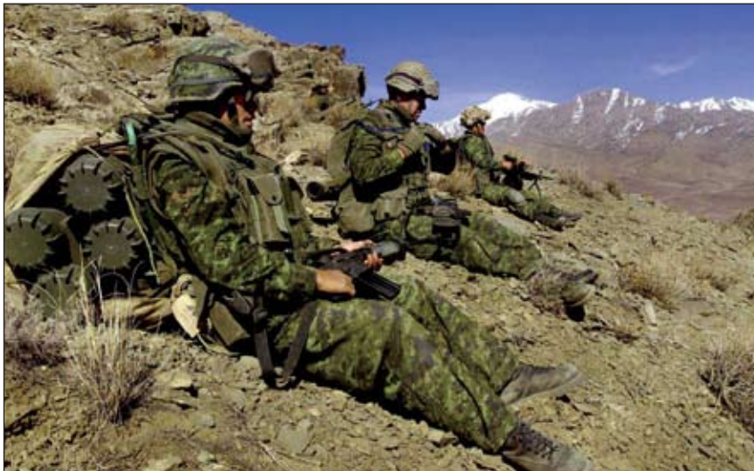
Des membres d'une équipe antichar du 3 e Bataillon Princess Patricia's Canadian Light Infantry prennent un repos bien mérité sur un sentier dans les montagnes de la province de Paktia, à l'est de Gardez, en Afghanistan.

d'une seule communauté présente sur tout le continent, n'a fait que suivre le changement de paradigme qui s'était produit 64 . C'est bien ce que démontre l'adoption mot à mot par des exemples, pratiques et doctrine des Américains. Cette interprétation explique l'absence d'indices, selon le modèle de Kuhn, lorsque le Canada a accepté la dimension opérationnelle de la guerre. McAndrew avait raison lorsqu'il faisait remarquer, à propos de la dissémination d'idées étrangères, que si les Forces canadiennes, notamment l'Armée de terre, ne s'étaient pas considérées comme l'extension d'une communauté provenant des États-Unis, l'entreprise aurait échoué.