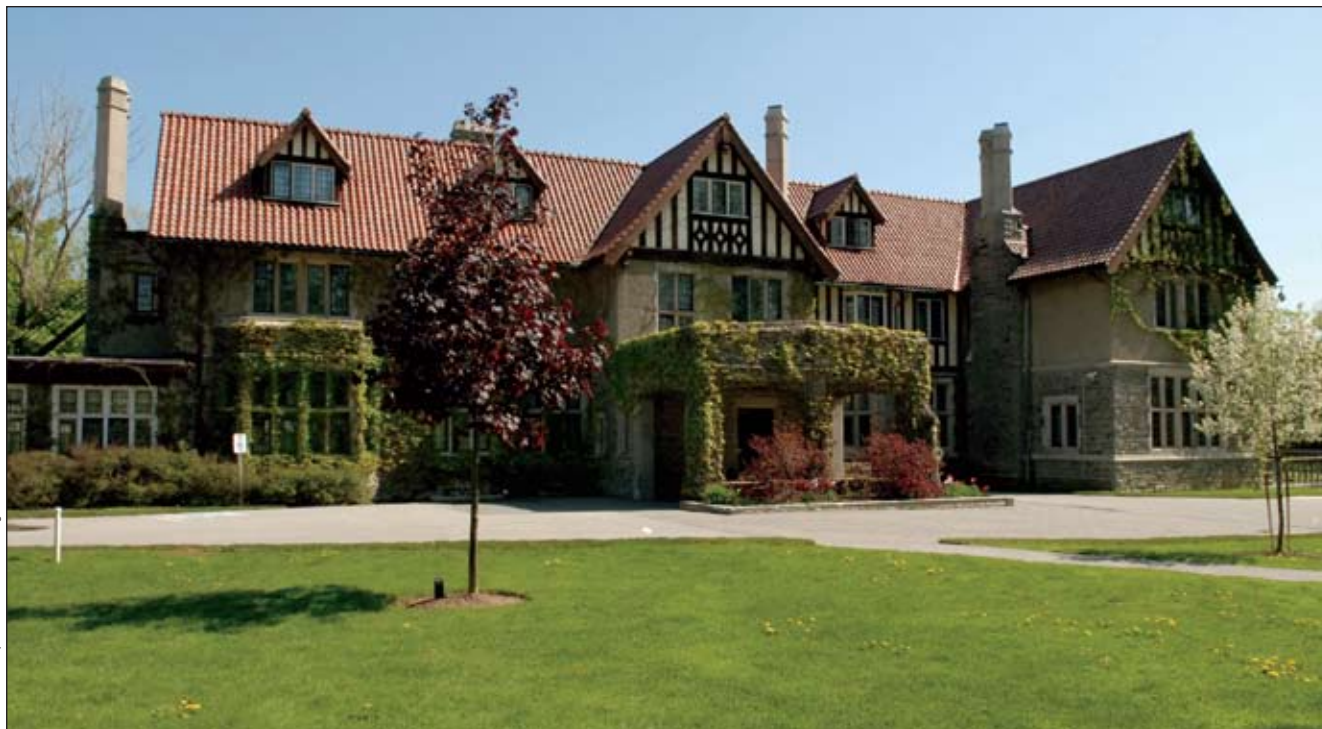
Le vénérable Mess des officiers du Collège des Forces canadiennes à Toronto