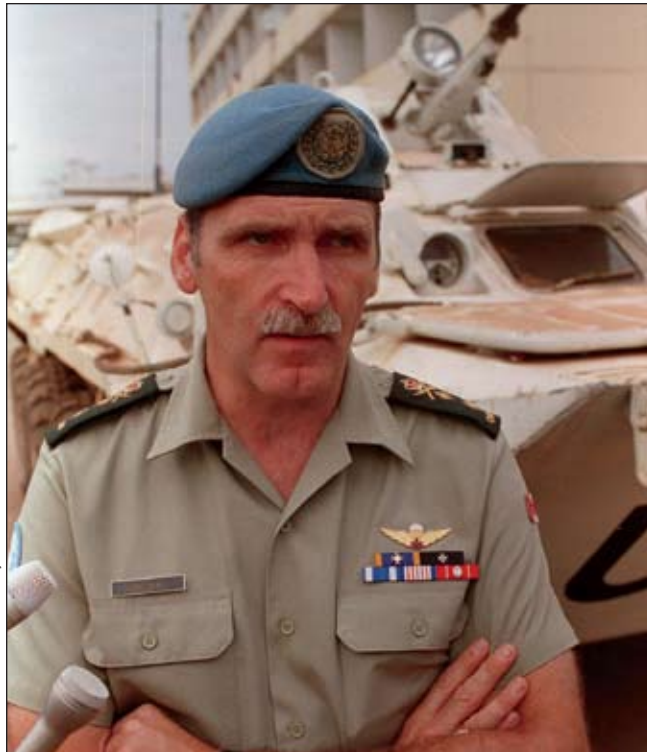
Major-général Roméo Dallaire

En l'absence de doctrine propre au Canada, le Programme de commandement et d'état-major de la force terrestre a adopté la définition américaine de la dimension opérationnelle. Bien que le programme ait présenté succinctement les doctrines et