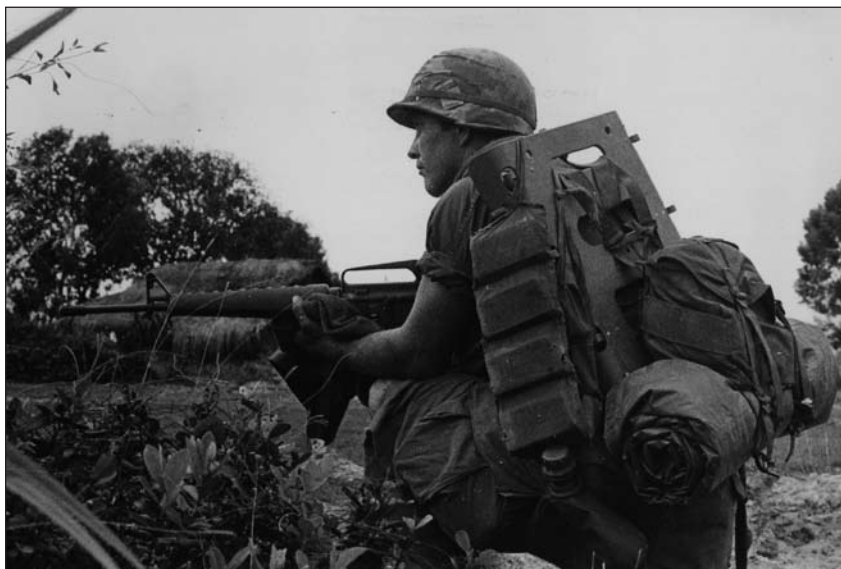
G.I. américain au front au Vietnam, vers 1968

Ces idées n'auraient toutefois pas pu s'implanter au Canada sans l'approbation du Conseil du perfectionnement professionnel des officiers, qui a été créé à titre d'organisme consultatif auprès du général occupant le poste de sous-ministre adjoint de la Défense (Personnel), à la suite des réformes prônées dans le