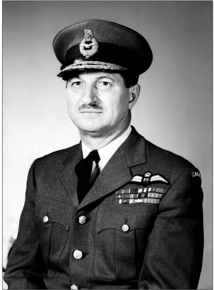
Le maréchal de l'Air Hugh Campbell, chef d'état-major de la Force aérienne, Aviation royale du Canada (ARC), vers 1957.

Les contacts de Miller avec l'armée de l'air américaine ont aussi profité aux programmes de mise à niveau des systèmes et d'acquisition de matériel, dont les CF-104 Starfighter destinés aux missions de combat et de reconnaissance en Europe, les missiles sol-air BOMARC et les intercepteurs CF-101 Voodoo pour la défense aérienne de l'Amérique du Nord. Miller a supervisé le financement et l'attribution des contrats pour ces coûteuses plateformes d'armes. Il n'est donc pas étonnant qu'il se soit souvent permis de commenter les politiques opérationnelles de