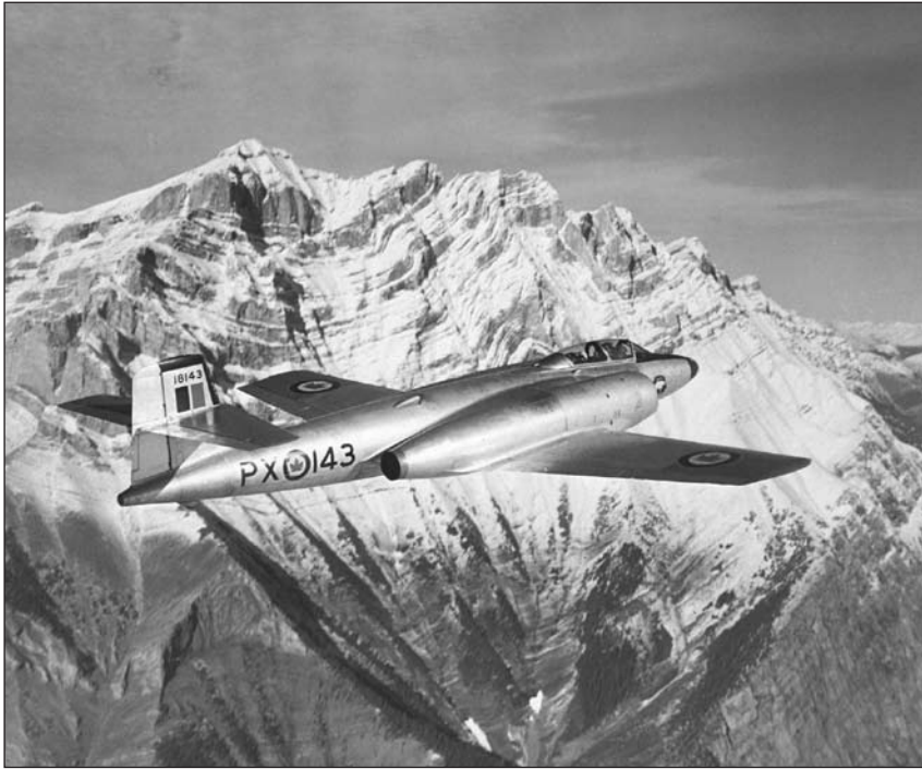
CITEC, photo RE68-1785