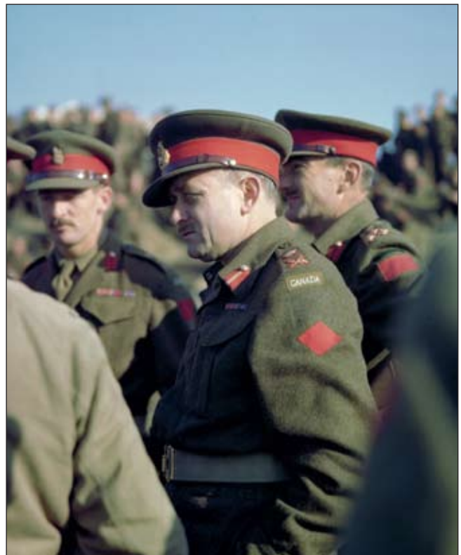
Le général Charles Foulkes en compagnie de ses commandants supérieurs en Italie pendant la Deuxième Guerre mondiale.