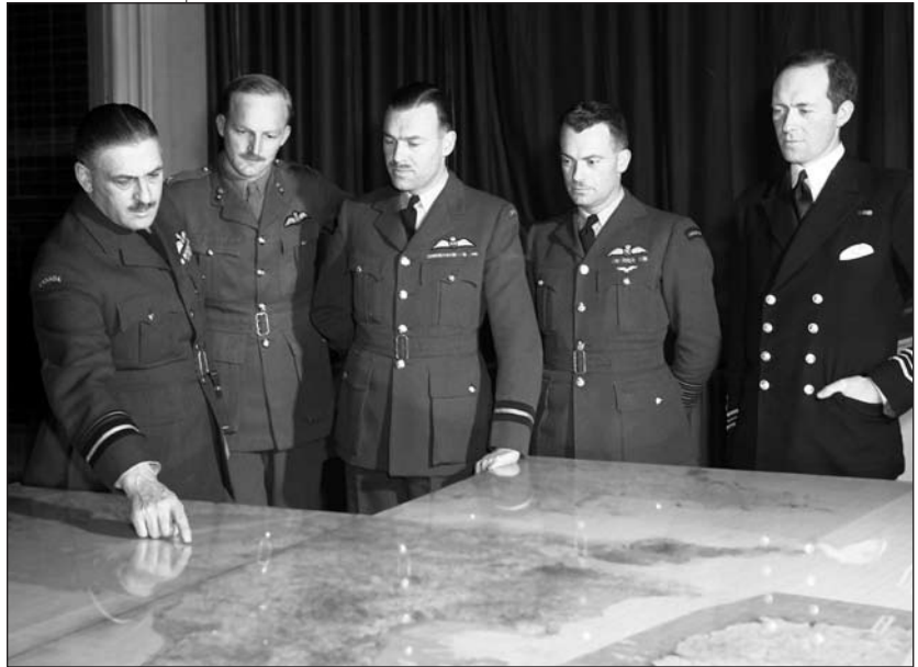
Roy Slemon (commodore de l'air au centre) alors qu'il servait dans le groupe de bombardement n° 6 en 1944.

Au cours d'une année où la plupart des vols de l'armée de l'air étaient interrompus, il a réussi, ce qui est étonnant, à suivre quatre cours d'instruction en vol 14 .