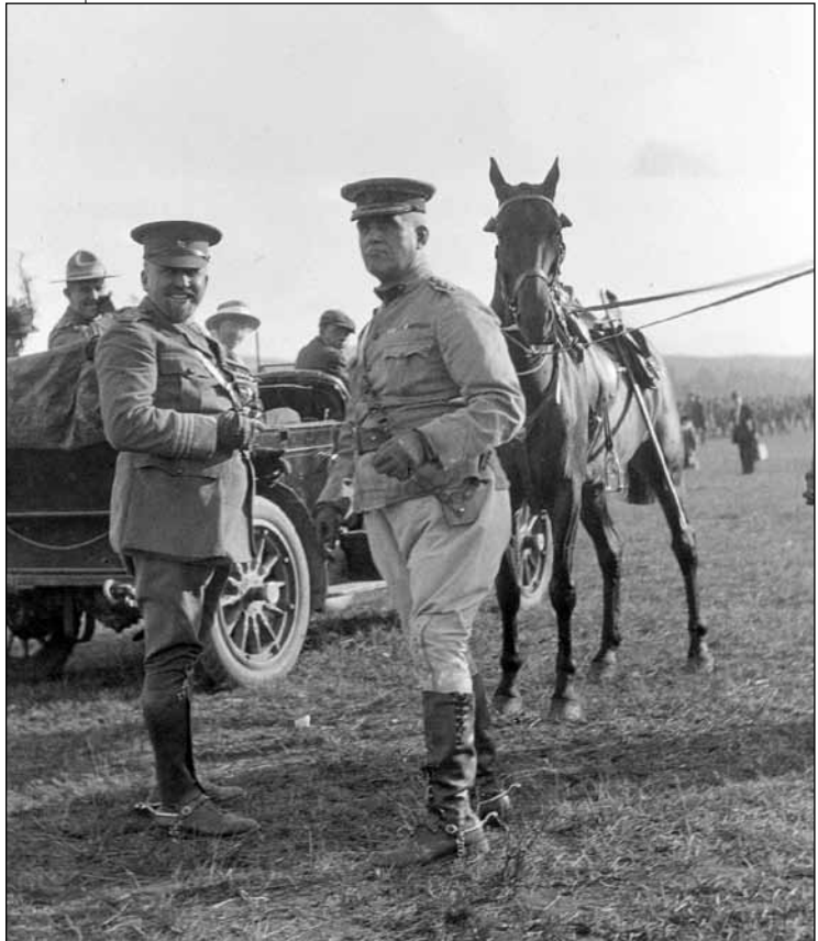
Le Colonel Sam Hughes au camp embryonnaire de Valcartier, le 13 septembre 1914.