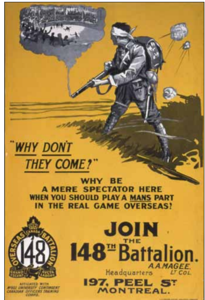
Why Don't They Come?...