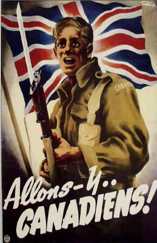
Allons-y...CANADIENS!, MCG 2002029-021