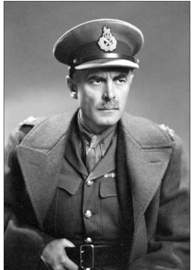
Le Général A.G.L. McNaughton, officier général chargé du commandement de la 1 re Division du Canada en 1939.