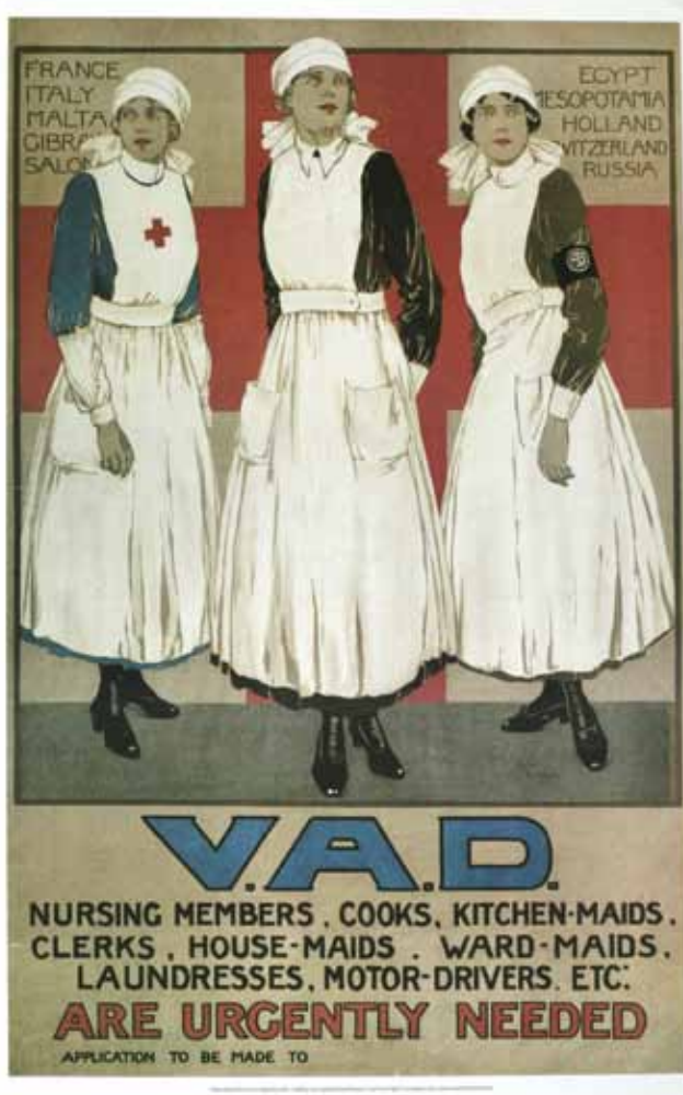
VAD Nursing Members...

Deux batteries d'artillerie de siège ont également recruté leurs membres à McGill – la 7 e en 1916 et la 10 e en 1917 –, car l'expertise de McGill en mathématiques, semblait-il, était une nécessité professionnelle pour les officiers d'artillerie lourde. Sans doute le survivant le mieux connu, le Sergent Brooke Claxton,