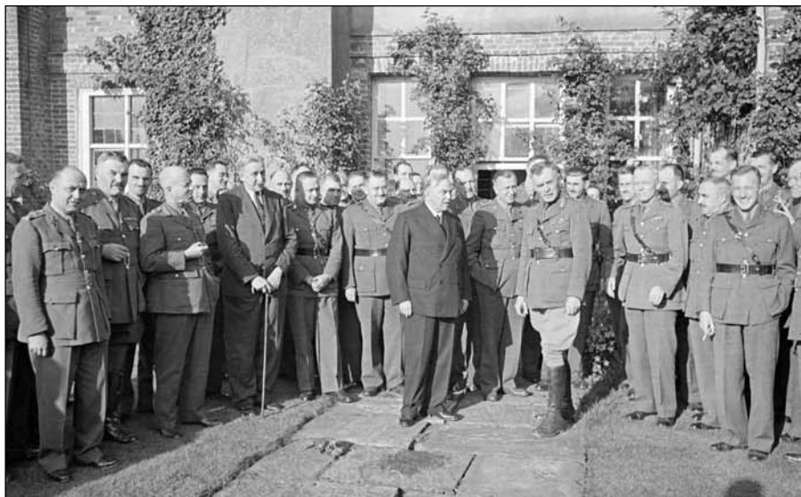
Le très honorable W.L. Mackenzie King et le Général A.G.L. McNaughton en compagnie d'officiers du 1 er Régiment d'artillerie moyenne de l'Artillerie royale canadienne, le 26 août 1941.