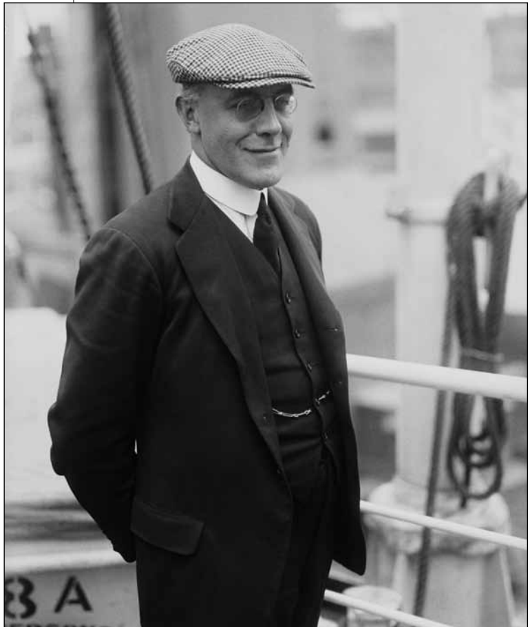
Sir Auckland Geddes à bord du SS Mauretania en 1922.

années 1900, tandis que la Grande-Bretagne, sous l'égide de son secrétaire d'État à la Guerre, Richard Haldane, entamait les préparatifs de l'armée britannique pour l'imminente guerre que ce dernier anticipait en Europe. La tradition britannique acceptait une modeste armée régulière volontaire dont les officiers étaient issus de l'aristocratie terrienne et professionnelle. Dans le but de doter cette armée de l'effectif dont elle aurait besoin pour s'engager dans une guerre en Europe, Haldane a choisi de